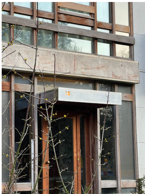
Vue porte d'entrée restaurée