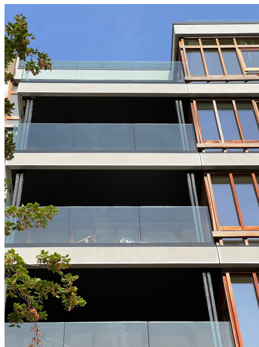
bande architectonique similaire à l'existante