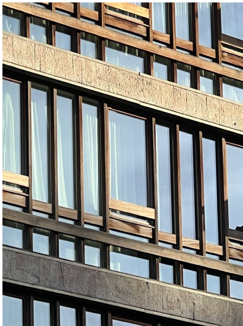
Décapage de la facade existante

Transformation et extension d'immeubles en 8 appartements – Rue de Belle Vue 18, 1050 Ixelles