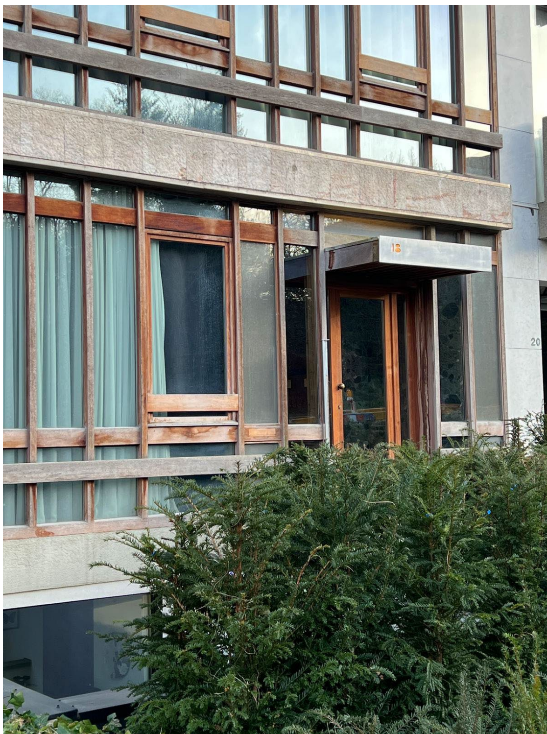
N°2 : Vue de la façade arrière depuis l'Avenue du Générale de Gaulle

Transformation et extension d'immeubles en 8 appartements – Rue de Belle Vue 18, 1050 Ixelles