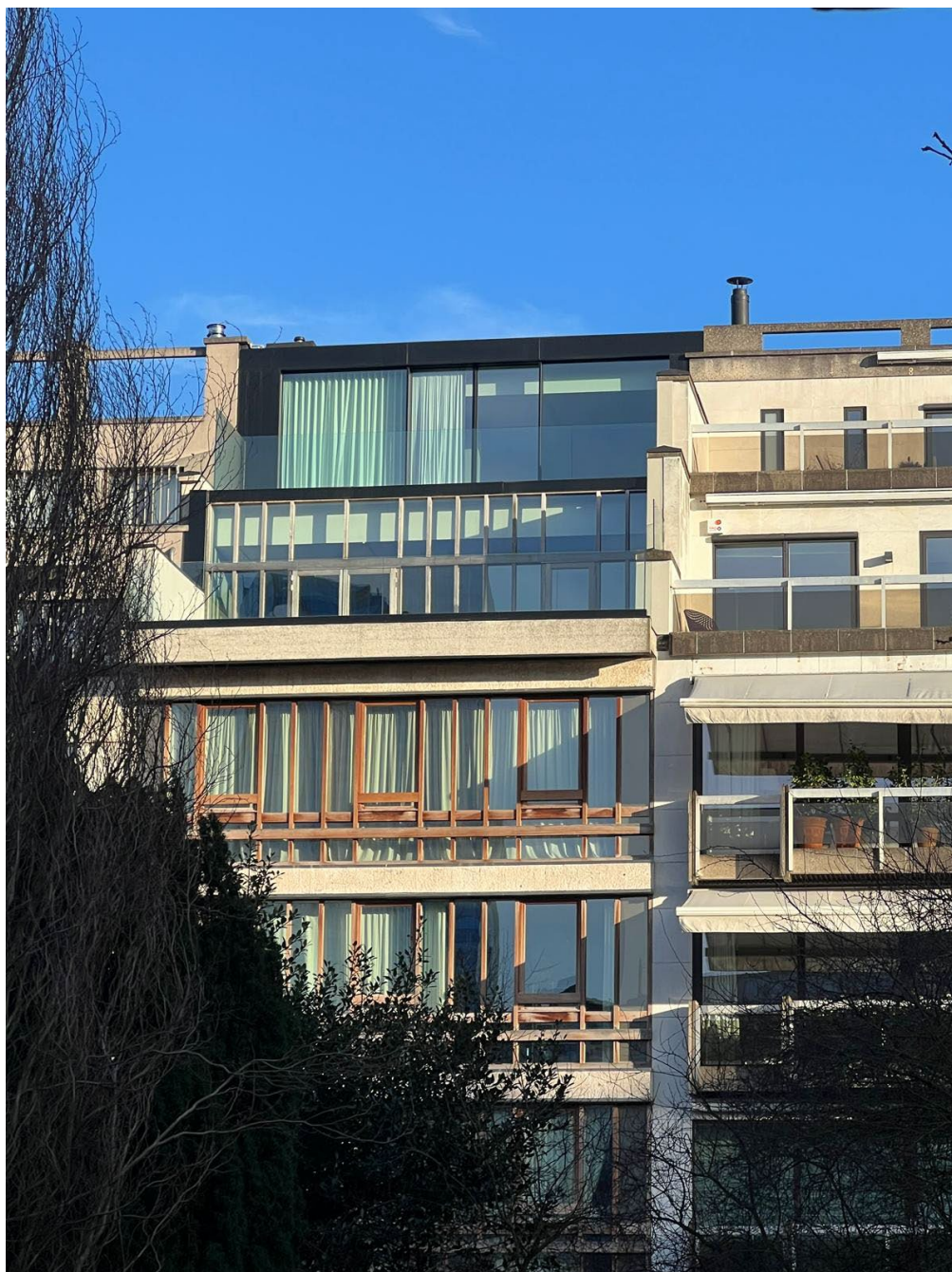
N°1 : Vue Rue de Belle Vue 18 sur l'entrée des logements