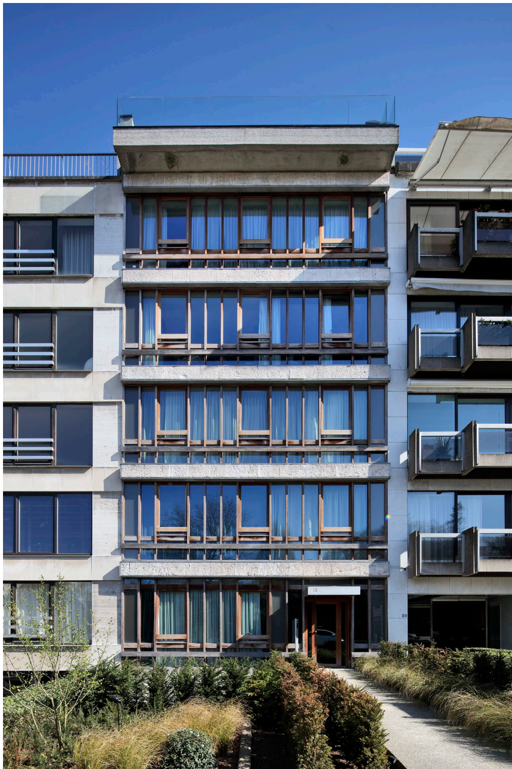
N°4 : Vue de la façade avant

Transformation et extension d'immeubles en 8 appartements – Rue de Belle Vue 18, 1050 Ixelles