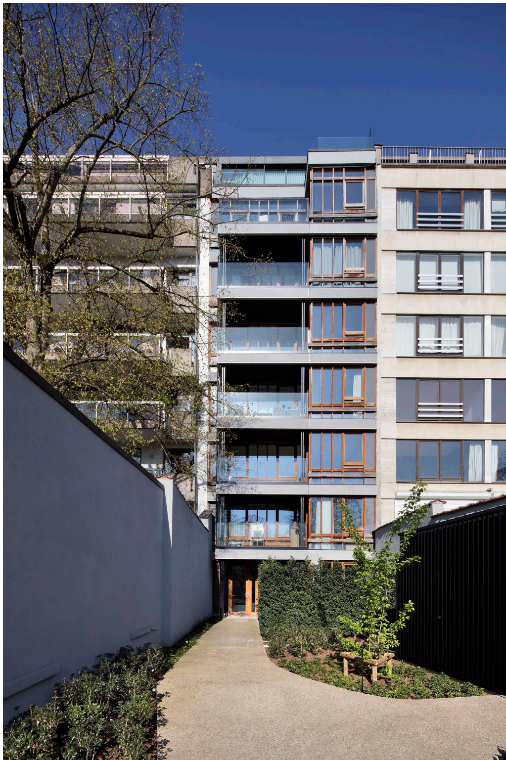
N°3 : Vue d'ensemble depuis de l'arrière des façades + local vélo

Transformation et extension d'immeubles en 8 appartements – Rue de Belle Vue 18, 1050 Ixelles