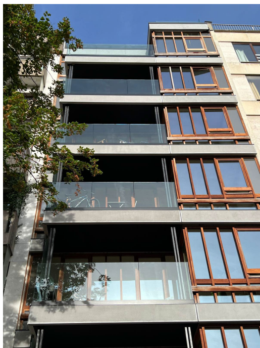
Balcons + restauration de la facade existante